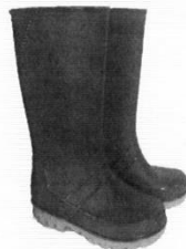
Botas de Jefe