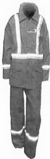
Uniforme de Mantenimiento

"AÑO DEL BICENTENARIO, DE LA CONSOLIDACIÓN DE NUESTRA INDEPENDENCIA, Y DE LA CONMEMORACIÓN DE LAS HEROICAS BATALLAS DE JUNÍN Y AYACUCHO"