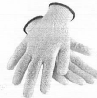
Guantes de Seguridad de Ohra