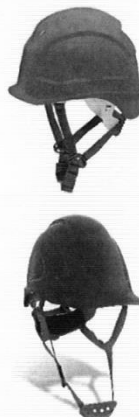
Casco de Seguridad