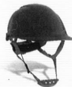
Casco de Seguridad