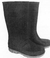
Botas de Jebe