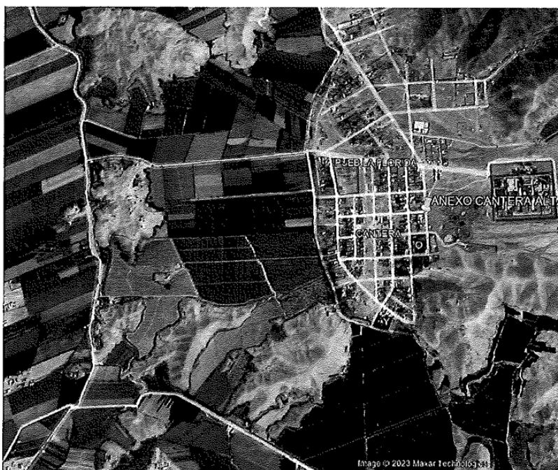
Fig.01 : sectores que se intervendrán con el proyecto.

Departamento : Lima Provincia : Cañete Distrito : Nuevo Imperial Localidad : Anexo Cantera Alta