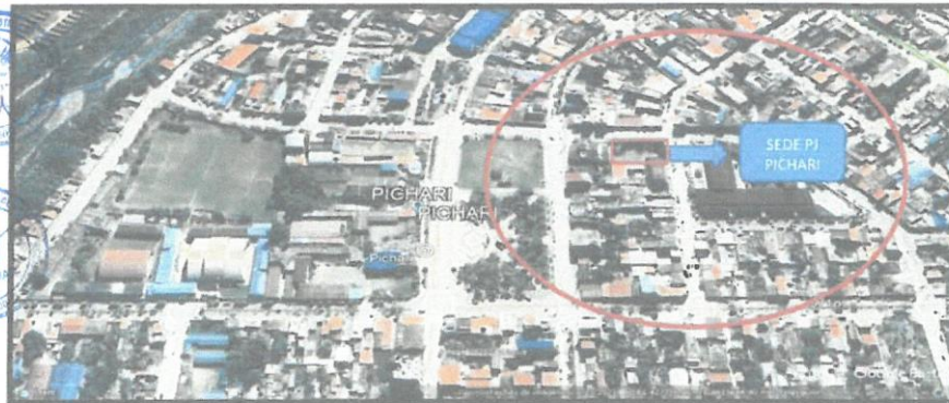
Mapa N° 2 Micro Localización del proyecto