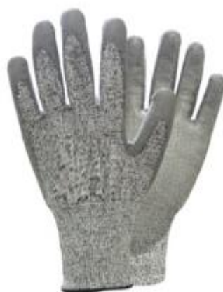
GUANTES DE TRABAJO