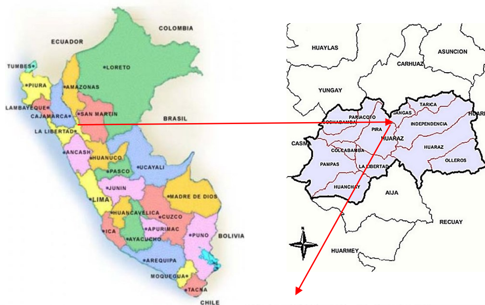
Gráfico 01. Rio Santa "Proyección de Puente Tipo Arco Metálico"