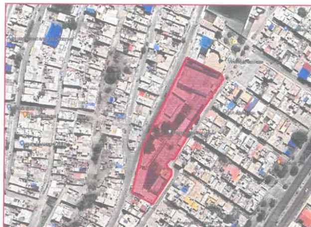
Imagen 01 – Imagen Satelital de la I.E.