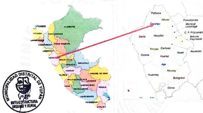
MAPA DE YUPÁN