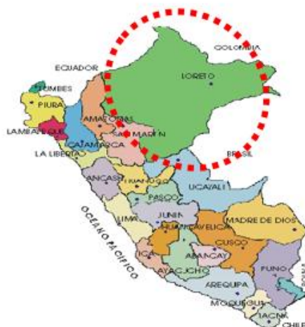
Departamento de Loreto