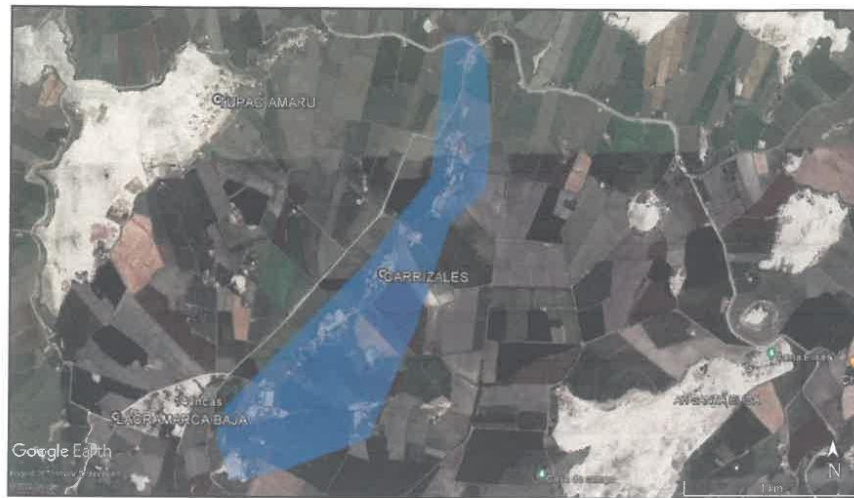
Imagen 01 - Vista satelital del Sector Carrizales.