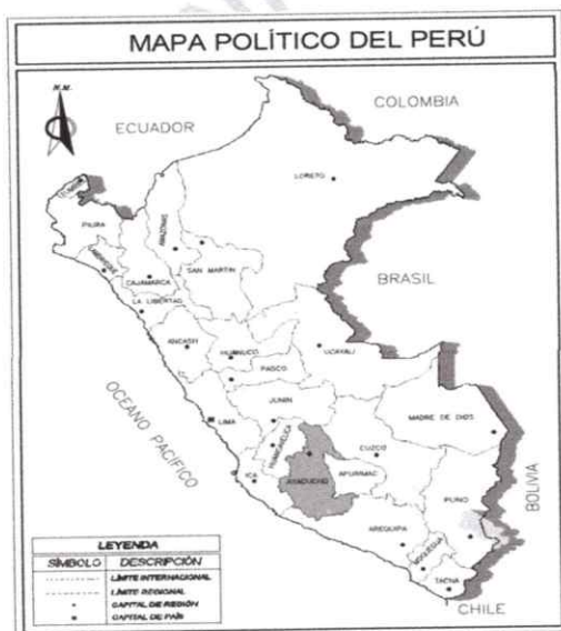
Figura 01: Mapa Político del Perú. Figura 02: Mapa Departamental de Ayacucho.