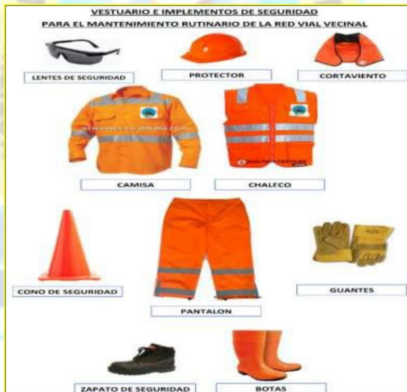
ELEMENTOS DE SEGURIDAD