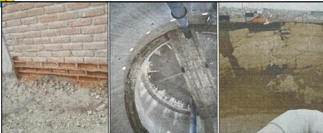
Foto N°01: Estado actual de la estructura de Cerco perimétrico y tanque elevado.