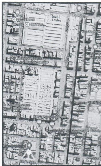
IMAGEN N° 10.- CALLE BOLIVAR DESDE CALLE 28 DE JULIO HASTA LA AVENIDA MEXICO