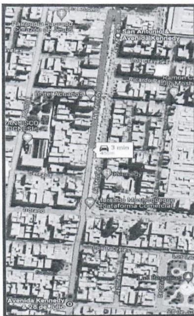
IMAGEN N° 09.- AVENIDA SIMON BOLIVAR DESDE AVENIDA EL DORADO HASTA LA CALLE SAN ANTONIO