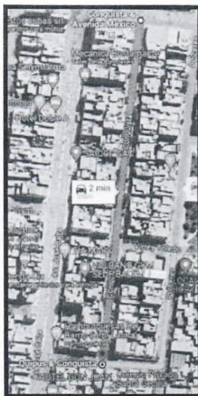
IMAGEN N° 17.- CALLE CONQUISTA DESDE AVENIDA NICOLAS DE PIEROLA HASTA IR LOS CURACAS