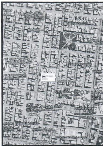
IMAGEN N° 19.- CALLE ARGENTINA DESDE LA CALLE HUSARES DE JUNIN HASTA LA CALLE INCANATO