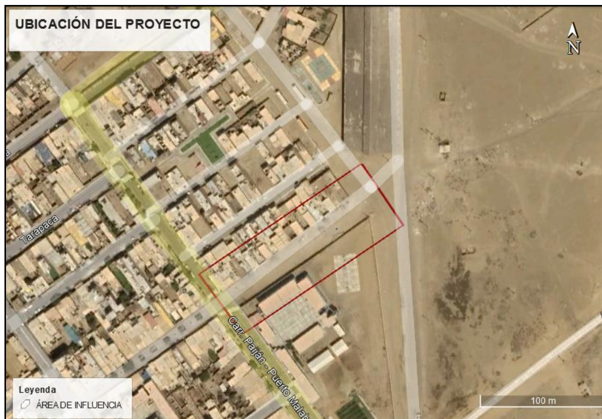
Figura N°4: Ubicación geográfica del proyecto.