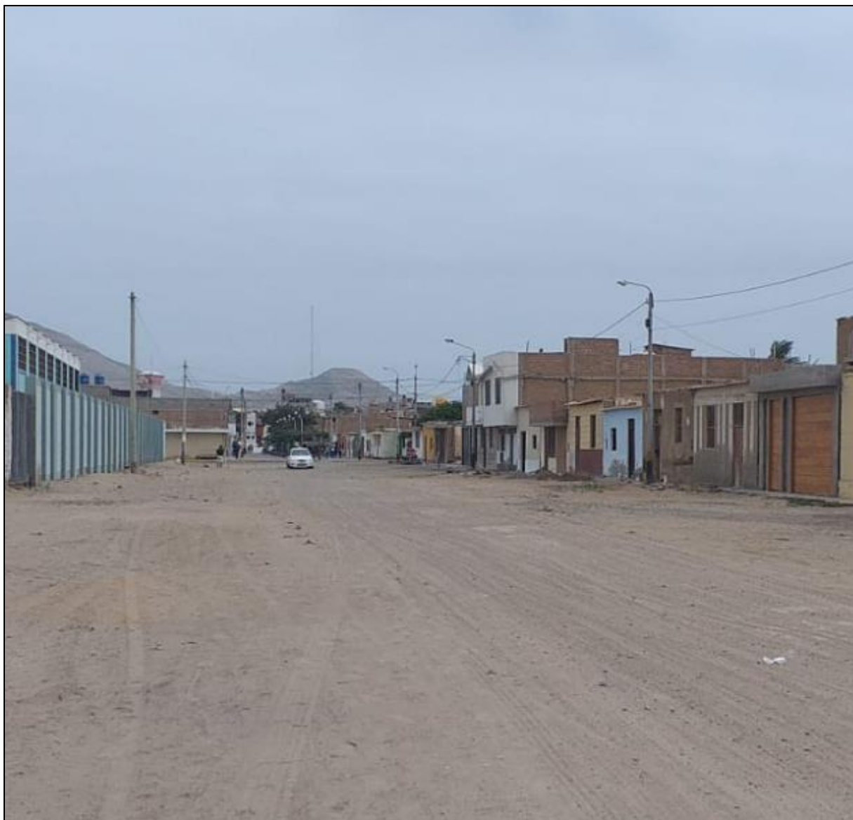
Figura N°5: Situación actual.