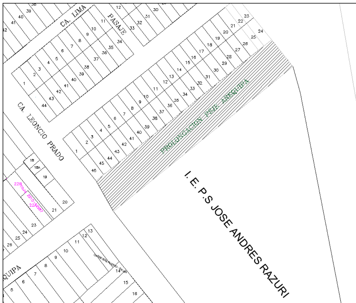
Figura N°5: Área de influencia.