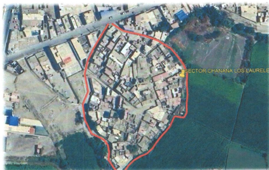
Figura 02: Vista Satelital del Área de estudio