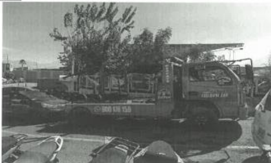
GRUA CON PLATAFORMA PARA TRASLADO DE 04 MOTOCICLETAS CON SU PROPIO SISTEMA HIDRAULICO