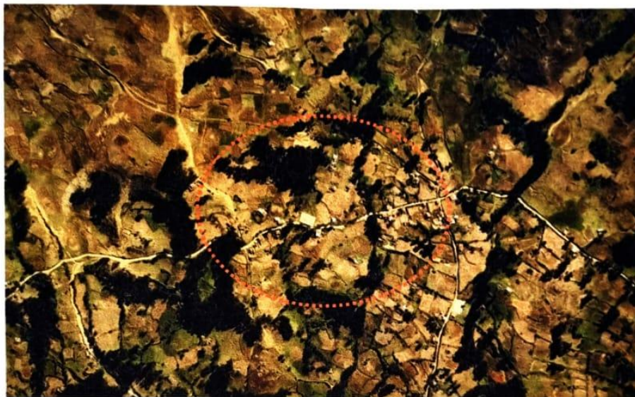
Imagen N° 1: Localización del sector de Ganto Jirca

"Año del Bicentenario, de la consolidación de nuestra Independencia, y de la conmemoración de las heroicas batallas de Junín y Ayacucho"