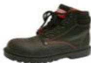
ZAPATO DE SEGURIDAD