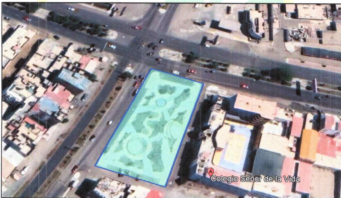
MICRO LOCALIZACION (DISTRITO DE NUEVO CHIMBOTE – PARQUE LA CULTURA)