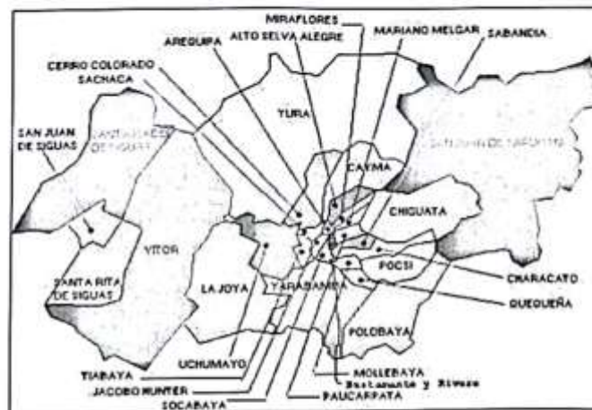
Imagen 01.- Provincia de Arequipa

"MEJORAMIENTO DEL SERVICIO DE TRANSITABILIDAD PEATONAL Y VEHICULAR DE LA CALLE CESAR ATAHUALPA Y CALLE 1 DE ASOCIACION URBANIZADORA ALTO LA ALIANZA Y AA. HH, LEON DEL SUR, DISTRITO JACOBO HUNTER, AREQUIPA – AREQUIPA" CUI 2508521