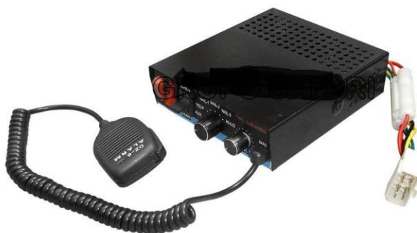
FOTO REFERENCIAL DE LA SIRENA