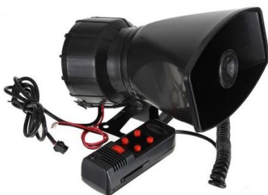
FOTO REFERENCIAL DEL PARLANTE