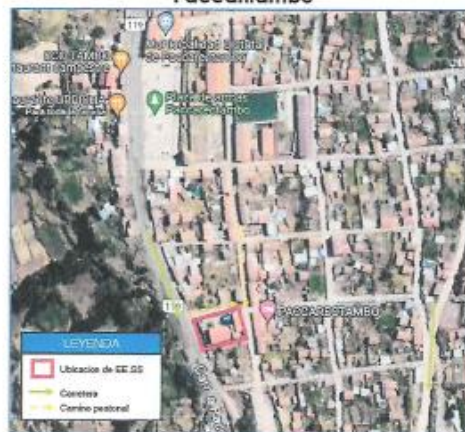
Ilustración 3: Ubicación actual del terreno del EE.SS Paccaritambo en el distrito de Paccaritambo

El Establecimiento de salud de Paccaritambo se encuentra ubicado en el Centro Poblado de Paccaritambo, de acuerdo al siguiente detalle