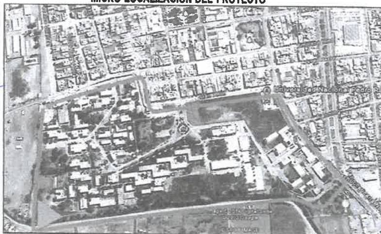
GRAFICO 01: Ámbito de influencia del proyecto ( ZONA VERDE ) Ciudad de Lambayeque vs Ciudad Universitaria, cual está ubicada en la Zona Sur Oeste (Arista cerco Sur)