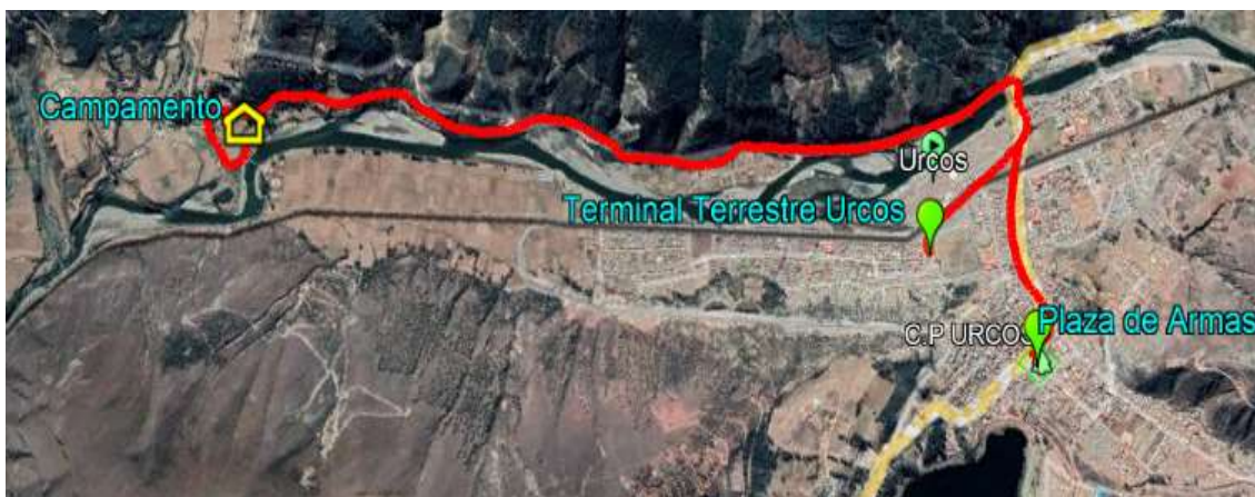
Imagen: Ubicación de la Obra.

La conformidad será otorgada por el Residente de Obra con V°B° del supervisor o inspector de obra, una vez recepcionada por EL ÁREA DE ALMACÉN DE OBRA.