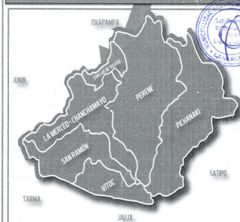
UBICACIÓN DEL DISTRITO DE CHANCHAMAYO