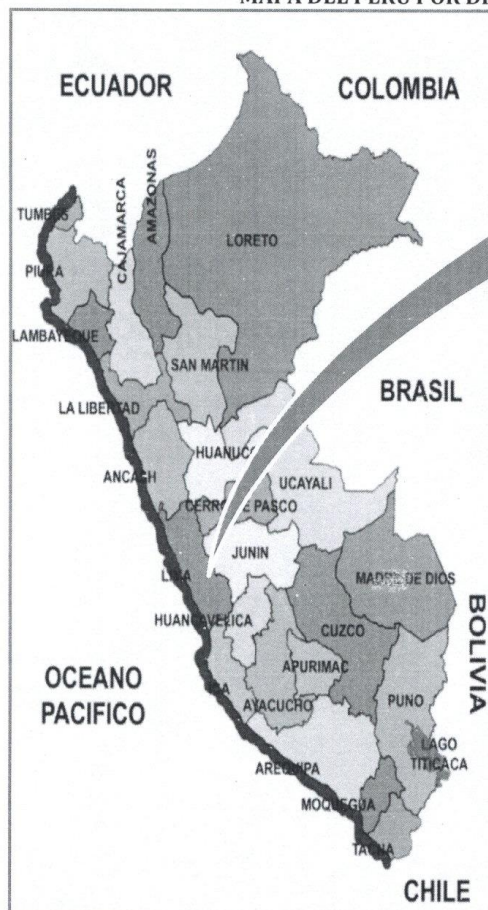
UBICACIÓN DEL DEPT. JUNÍN