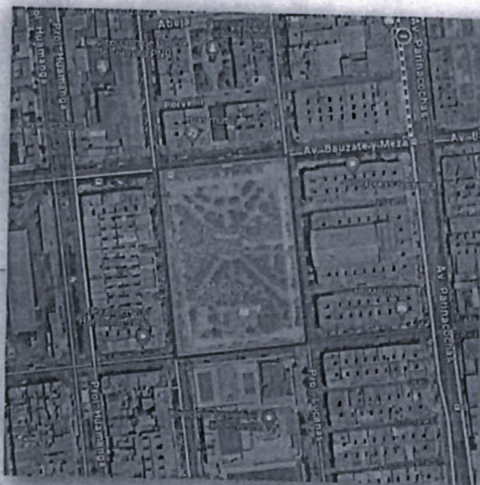
IMAGEN N° 01

La ubicación del proyecto refiere a lo siguiente: