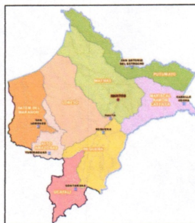
UBICACIÓN DEL DISTRITO DE PUINAHUA