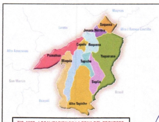
FIG. N°02: LOCALIZACION DE LA ZONA DEL PROYECTO