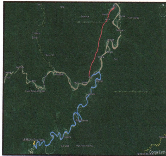
FIG. N°03: UBICACIÓN DEL TERRENO DEL PROYECTO