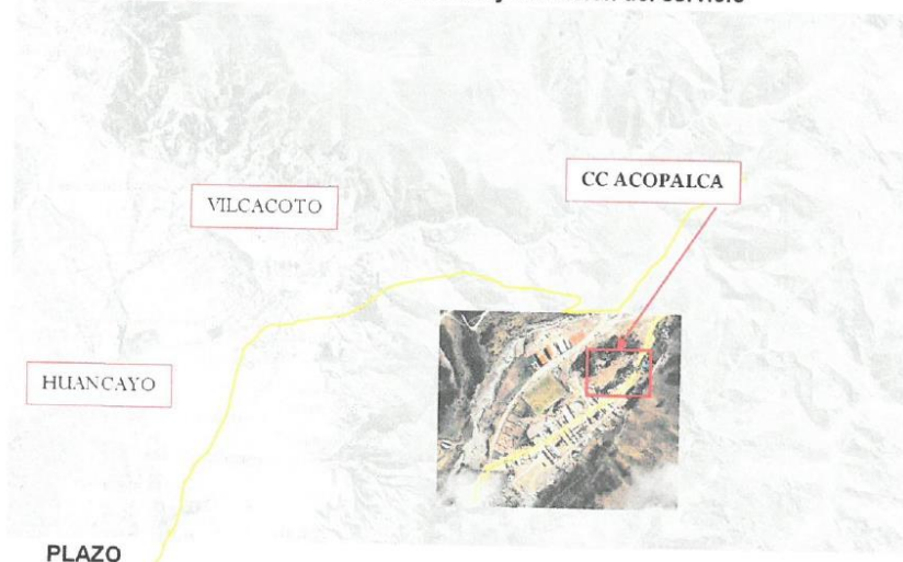
Imagen N° 1. Vista de acceso y ubicación del servicio

El servicio se encuentra localizado en la comunidad de Acopalca, Distrito de Huancayo- provincia de Huancayo - departamento de Junín. Para coordinaciones en la EPS SEDAM HUANCAYO S.A. ubicada en JR. JUNIN NRO. 987 URB. CERCADO JUNIN - HUANCAYO – HUANCAYO.