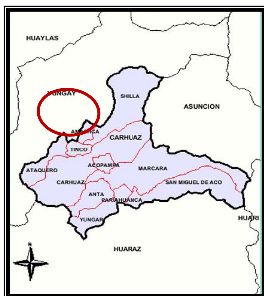
Figura N° 1: Ubicación del área de estudio.