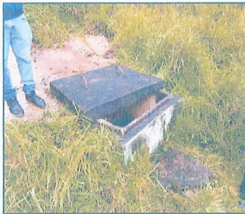
FIGURA N° 15: CAPTACIÓN LA TOTORILLA PARTE EXTERIOR

Es una de la captación que junto con la captación la Totorilla abastece al 30% de Caramarca Chico parte Alta, fue construida por Caritas hace más de 20 años, cumpliendo ya su vida útil de igual manera que la captación la Totorilla se encuentra en malas condiciones por su antigüedad y falta de mantenimiento a la no contar con su JASS formalizada, como se puede apreciar tampoco cuenta con cerco perimétrico para protección de la estructura, se aprecia la estructura dañada, de acuerdo a la resolución N° 066-2021-ANA-AAA.M-ALA.CHIL acredita la disponibilidad hídrica superficial anual de la captación totorilla y Pumaca es hasta : 9145.400 m 3 /año. (0.29 l/s).