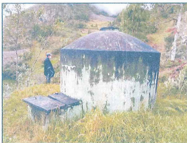
FIGURA N° 20: RESERVORIO

Se ha considerado la demolición y construcción de un nuevo reservorio cumpliendo con los cálculos hidráulicos y estructurales, considerando el mismo lugar para la construcción.