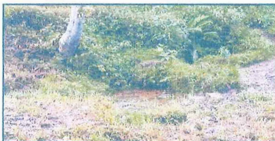
FIGURA N° 26: CAPTACIÓN LA PALMA

Existen tres fuentes de agua destinadas a abastecer la demanda de agua del proyecto, la primera llamada La Palma abastecerá a Caramarca Chico parte baja y las otros dos La Pumaca y Totorilla abastecerán a Caramarca Chico parte alta: dichas fuentes son de agua tipo superficial (manantial).