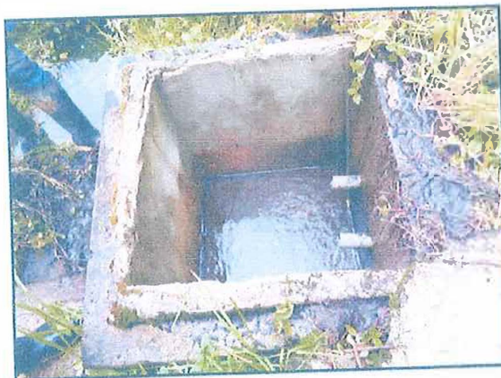
FIGURA N° 18: CAPTACIÓN LA PUMACA PARTE EXTERIOR