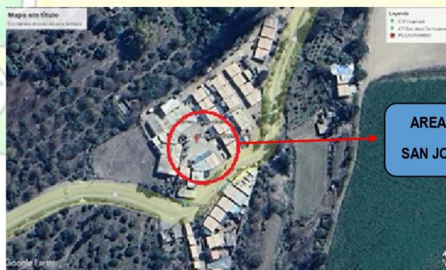
FOTOGRAFIA N°1: Localización del proyecto.