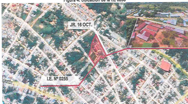
Figura 4: Ubicación de la I.E 0255