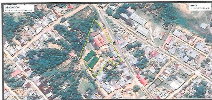
Imagen 04: Ubicación del Proyecto

"Capital Folklórica de la Amazonía Peruana" "AÑO DE LA UNIDAD, LA PAZ Y EL DESARROLLO"