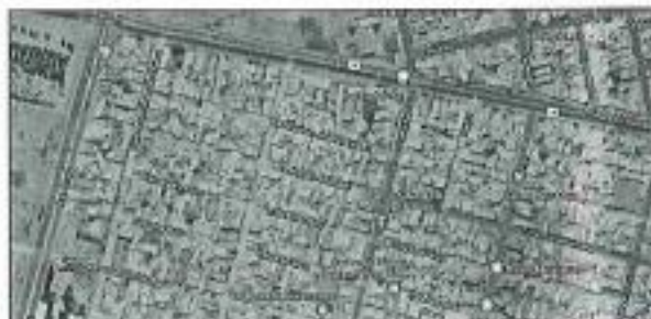
Ilustración 2: Localización del proyecto