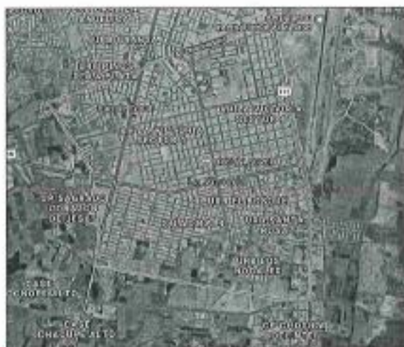
Ilustración 1: Distrito La Victoria, provincia de Chiclayo

DEPARTAMENTO : Lambayeque PROVINCIA : Chiclayo DISTRITO : La Victoria