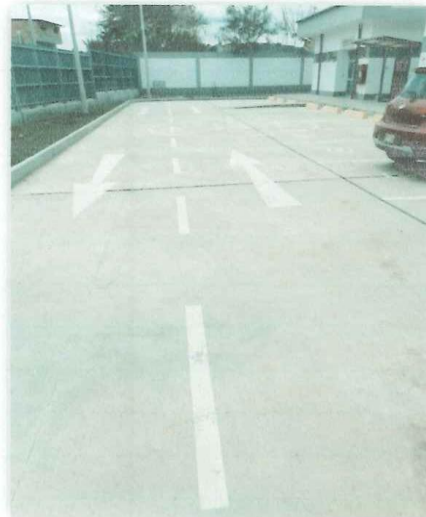
En la imagen tomada en Marzo de 2024, se puede apreciar el estado de la pintura en pavimento (señalética horizontal), que será repintado para el correcto flujo de vehículos dentro de las instalaciones.