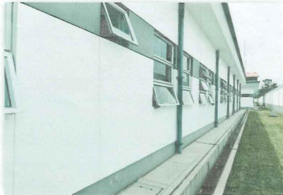
En la imagen tomada en Marzo de 2024, se puede apreciar el estado en el que se encuentra los exteriores del Centro de Salud.