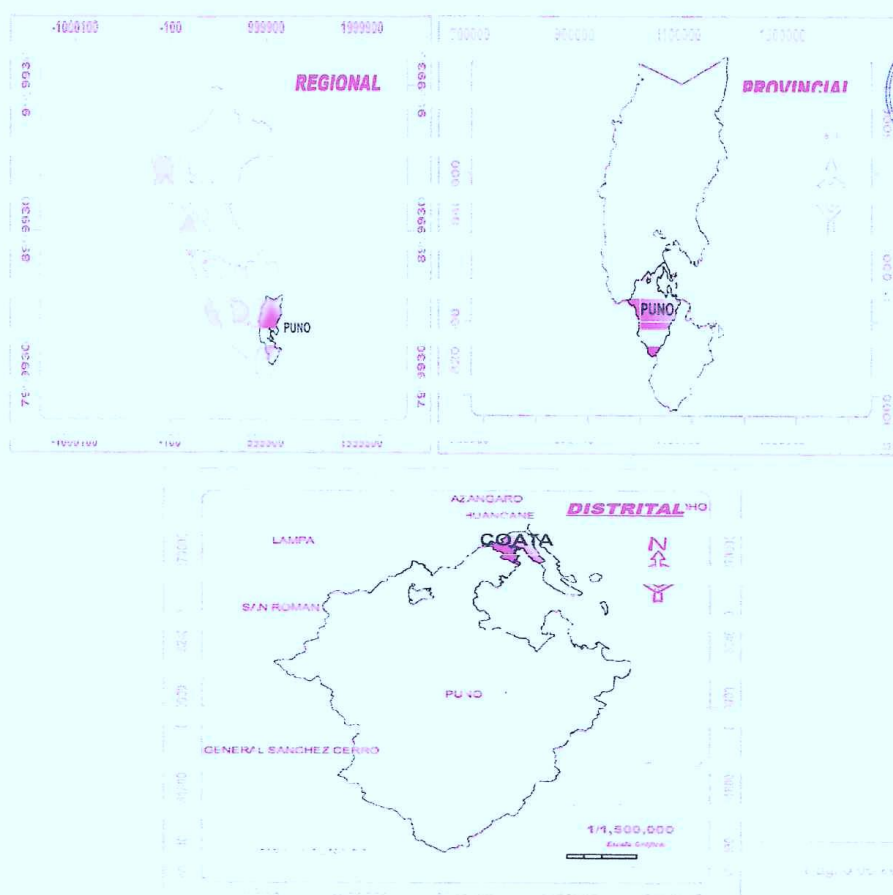
Imagen N° 01: Localización del Proyecto