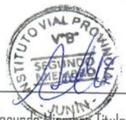
Segundo Miembro Titular

ACTA SUSCRITA EN ORIGINAL POR LOS MIEMBROS DEL COMITÉ DE SELECCION