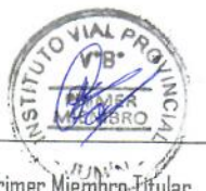
Primer Miembro Titular