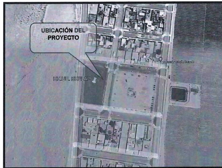
IMAGEN N° 02 – UBICACIÓN DEL PROYECTO