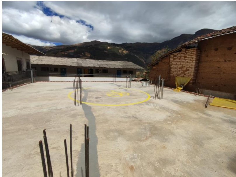
Imagen 01: Vista De Terreno Para La Construcción Del Proyecto

La Institución Educativa Ciro Alegría del Distrito de Sartimbamba cuenta con un terreno disponible para la construcción de infraestructura, por lo que se proyecta realizar este anhelado proyecto.