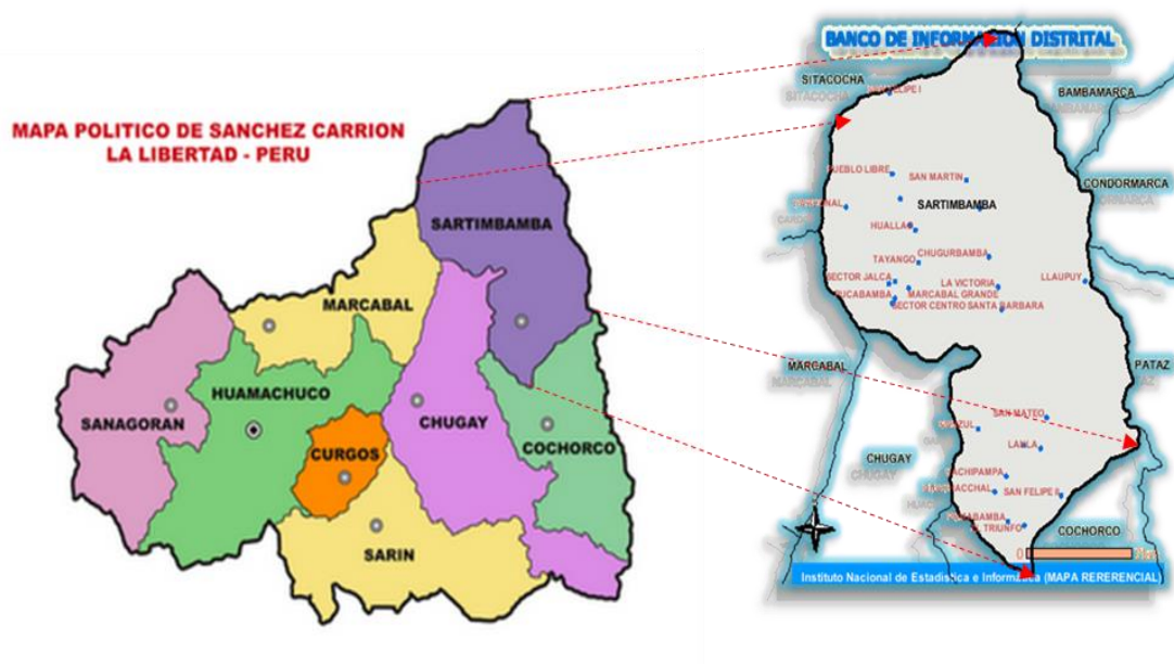
Imagen 03: Ubicación del Distrito de Sartimbamba en el contexto Provincial