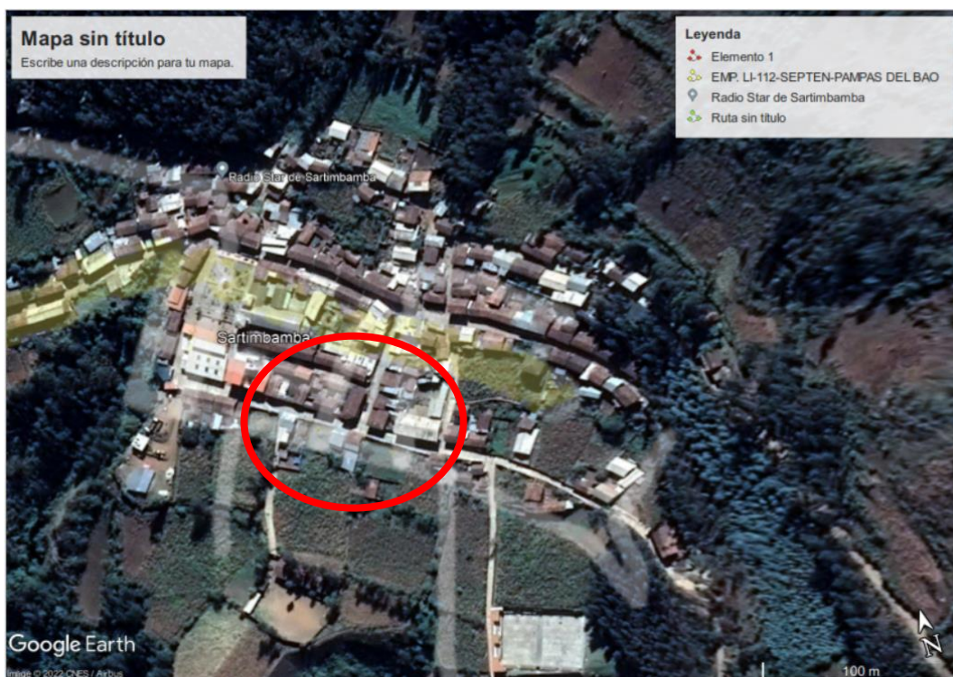
Imagen 04: Ubicación del proyecto