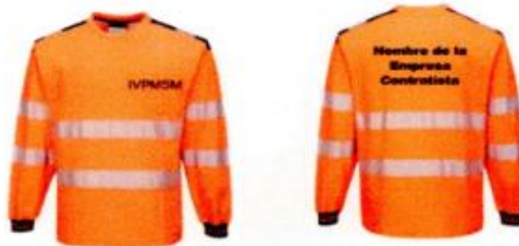
Imagen Polo Manga Larga de seguridad