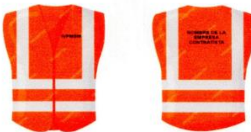
Imagen Chaleco de seguridad