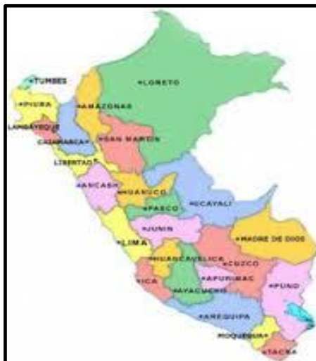
GRÁFICO N° 03: LOCALIZACIÓN