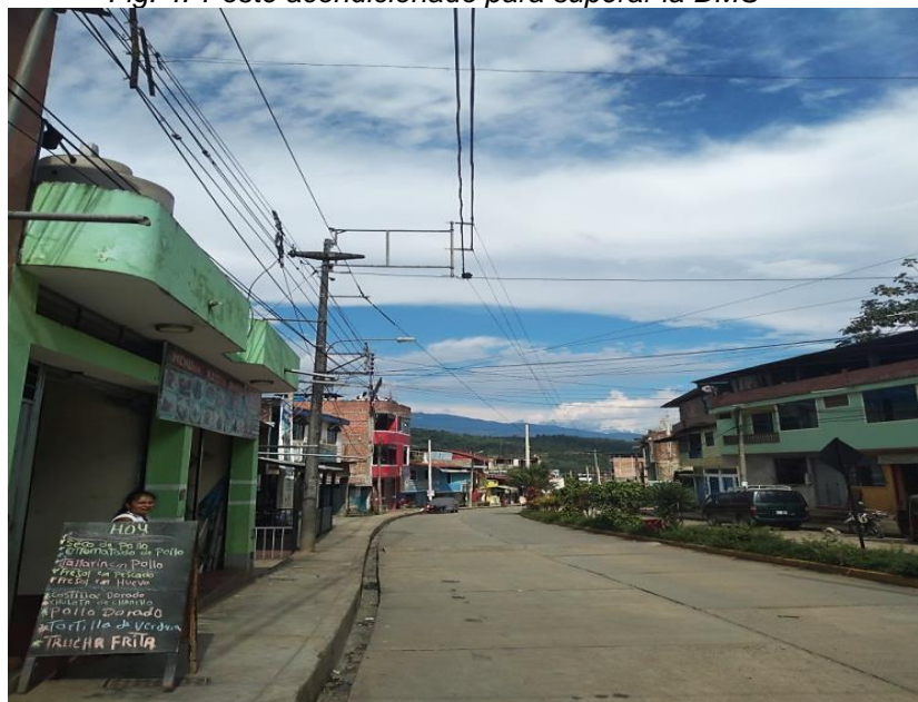
Fig. 4. Poste acondicionado para superar la DMS