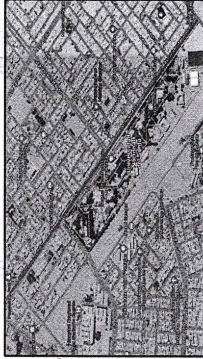
01. Ubicación del Proyecto

DEPARTAMENTO : Ancash PROVINCIA : Santa DISTRITO : Nuevo Chimbote LOCALIDAD : Av. Universitaria