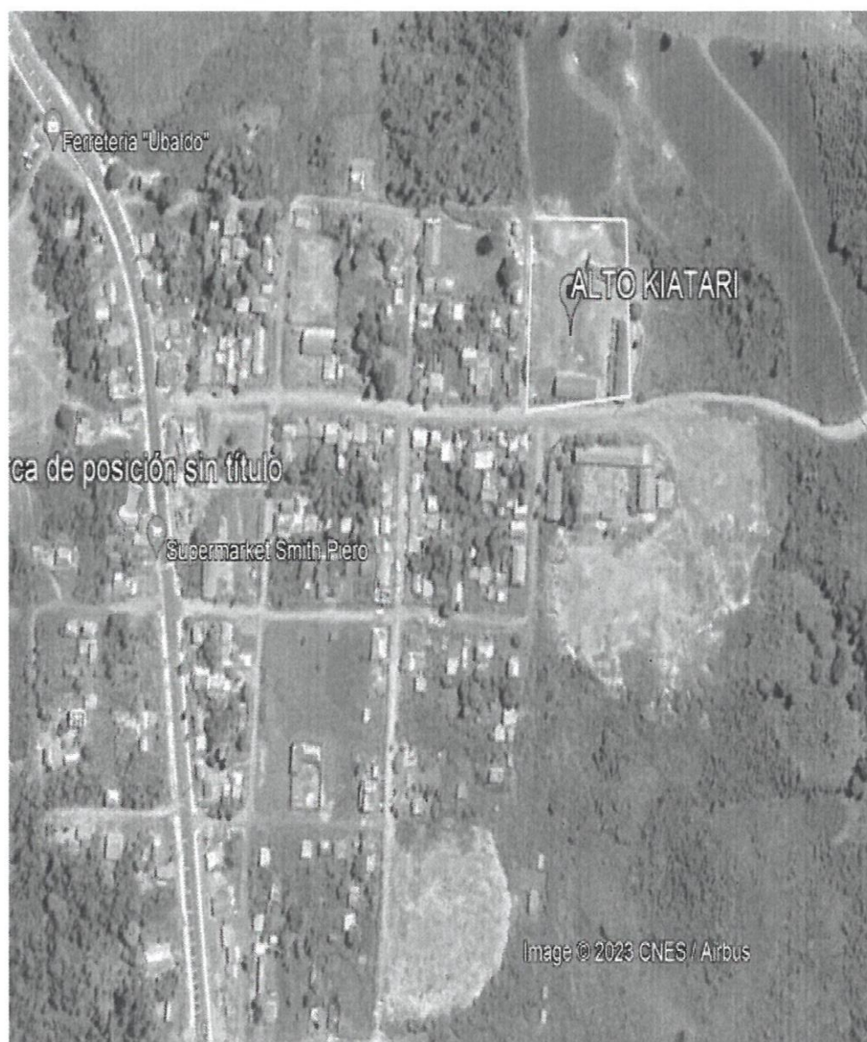
GRAFICO N°01: LOCALIZACIÓN

Ubicación geográfica del terreno proyectado para la renovación de infraestructura deportiva con Techo Parabólico