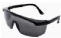
LENTES DE SEGURIDAD