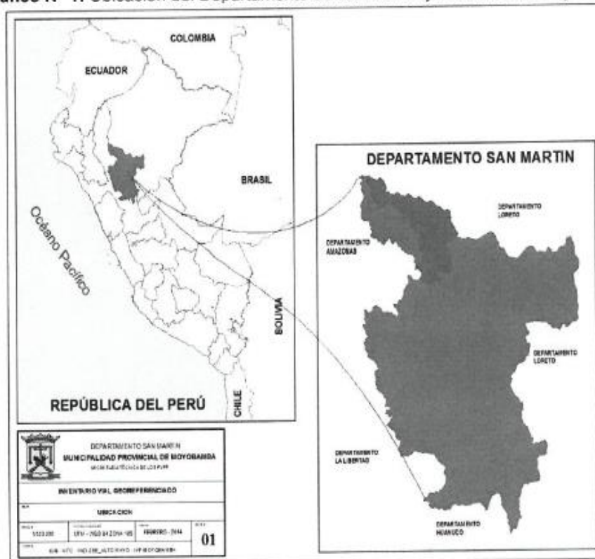
Gráfico N° 1: Ubicación del Departamento de San Martín y Provincia de Moyobamba