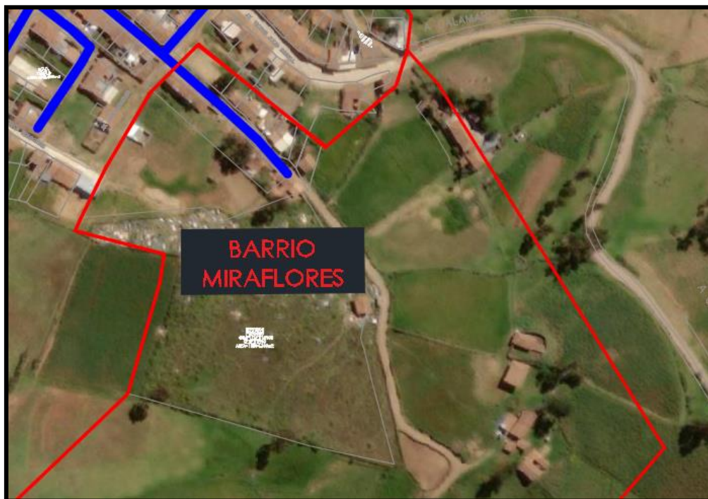
Figura N°4: Ubicación Ámbito de Influencia Barrio Miraflores