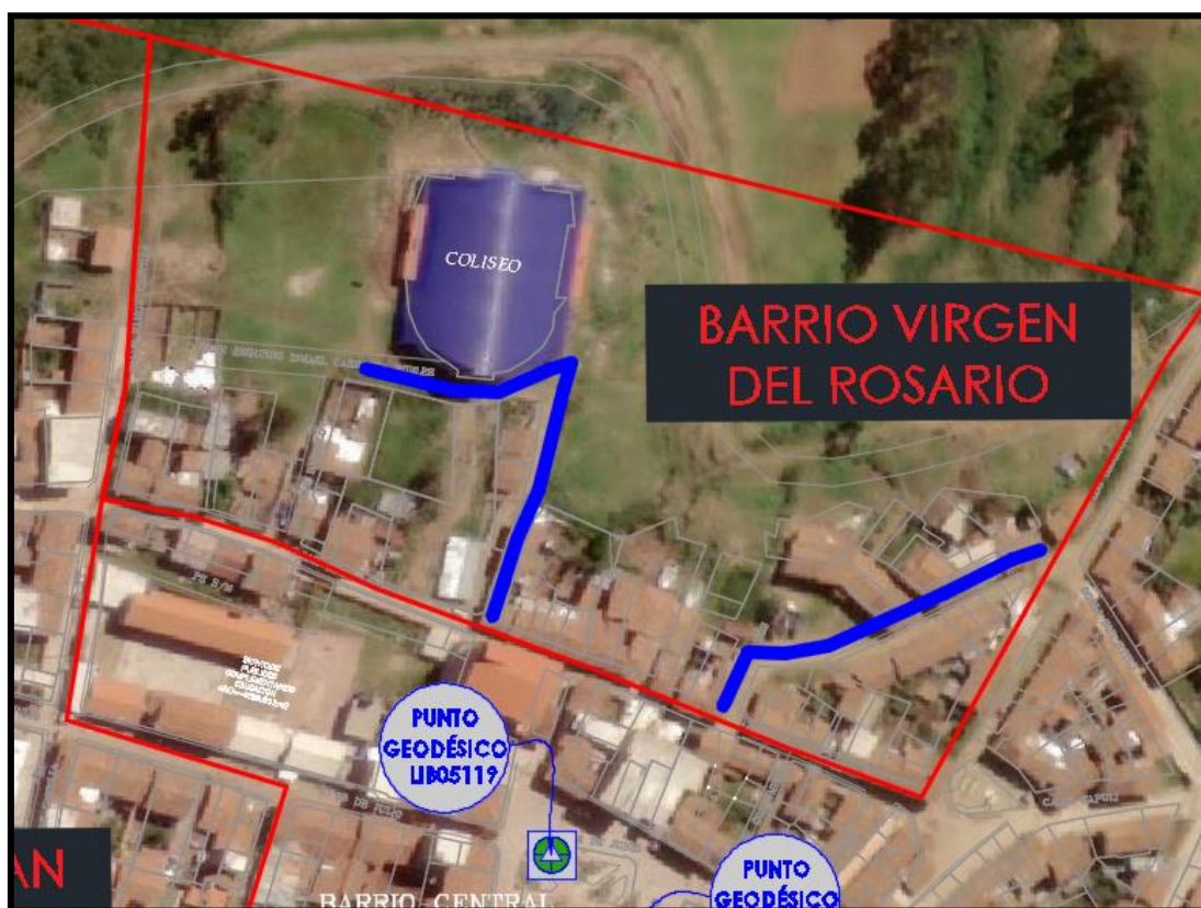
Figura N°2: Ubicación Ámbito de Influencia Barrio Virgen del Rosario