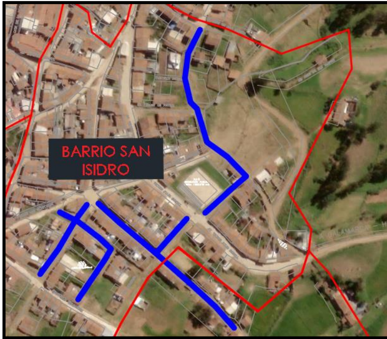
Figura N°3: Ubicación Ámbito de Influencia Barrio San Isidro