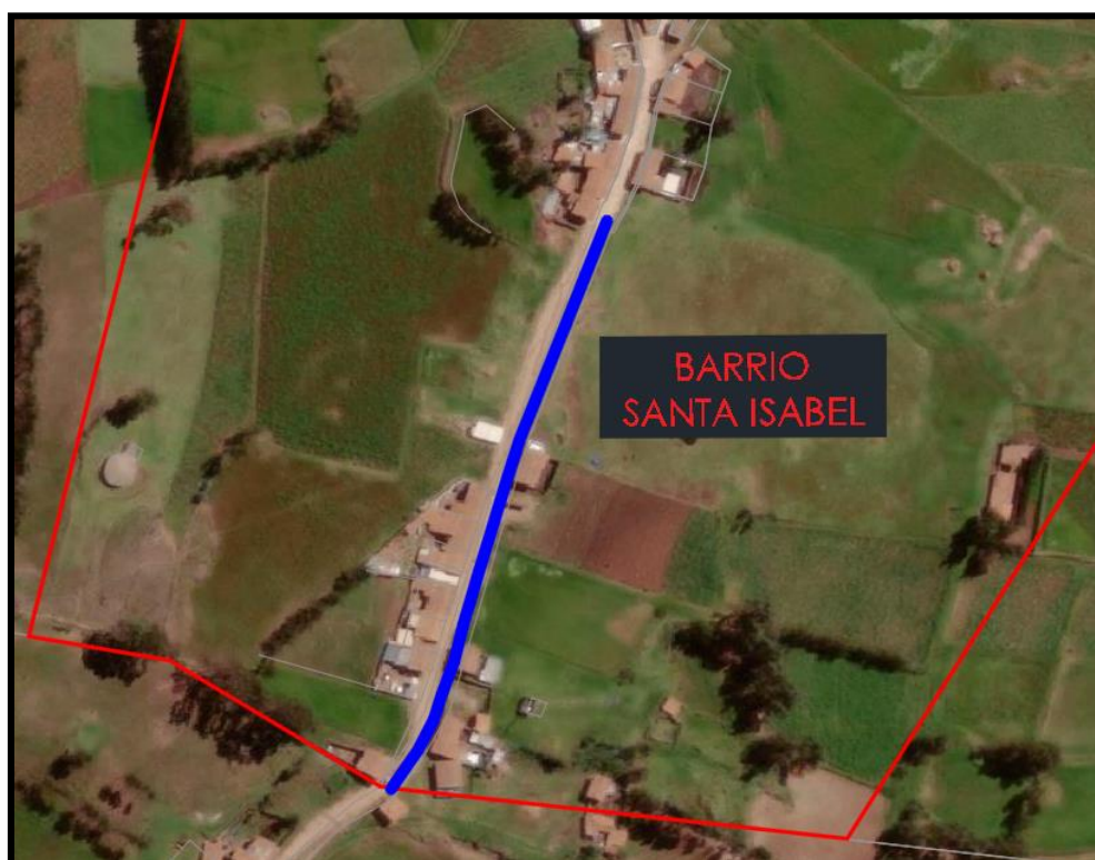
Figura N°6: Ubicación Ámbito de Influencia Barrio Santa Isabel