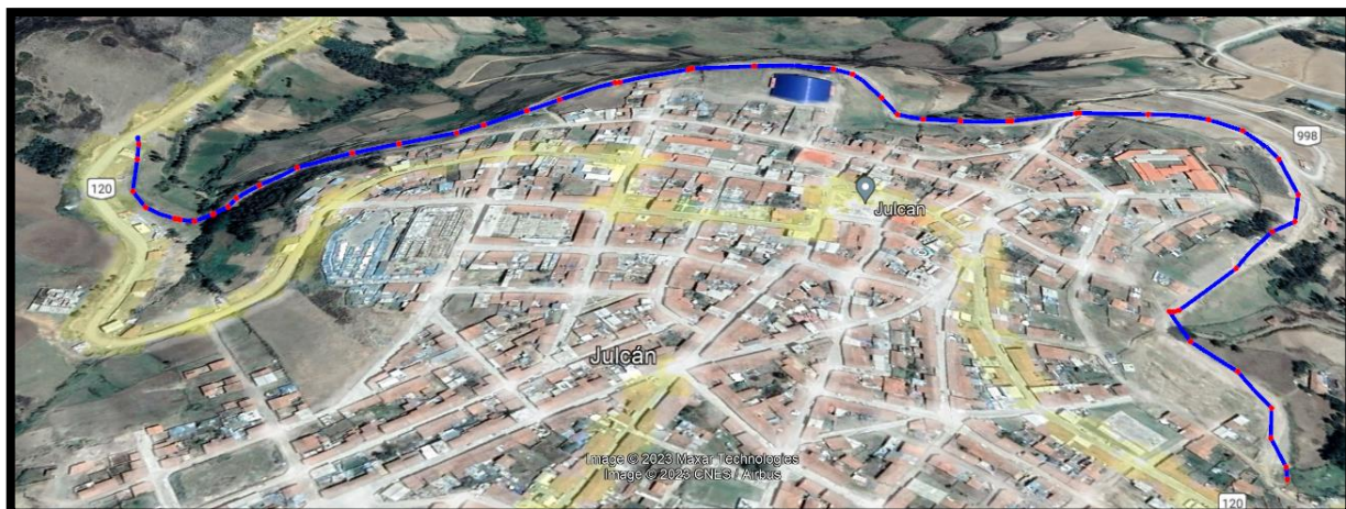
Figura N°8: Ubicación Ámbito de Influencia de la vía de evitamiento