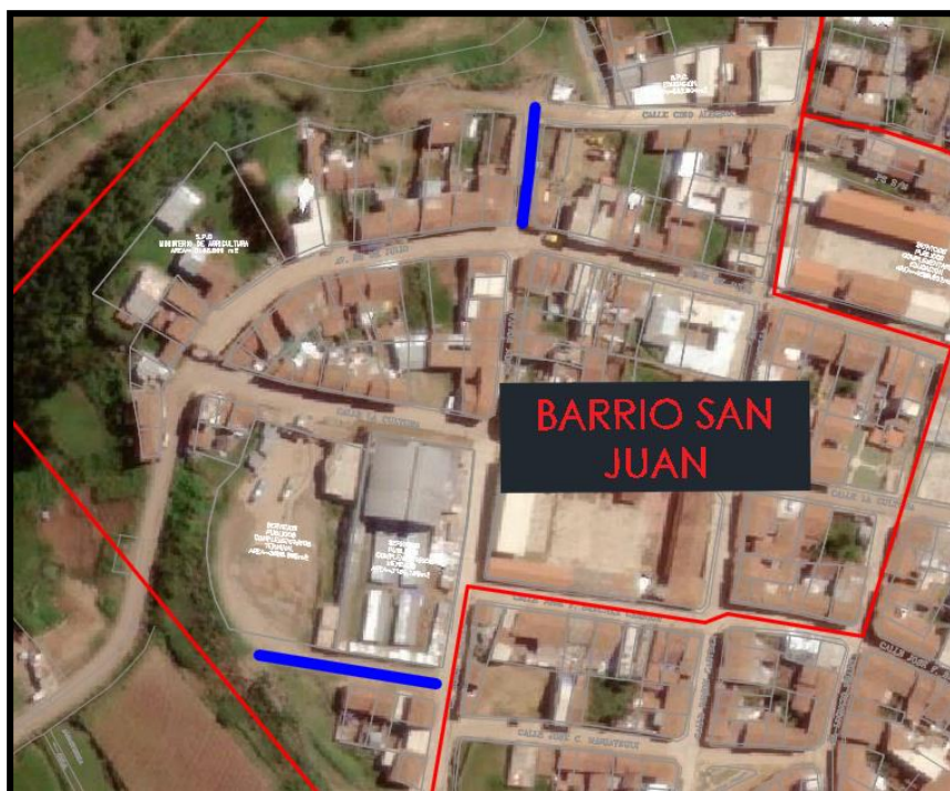
Figura N°1: Ubicación Ámbito de Influencia Barrio San Juan