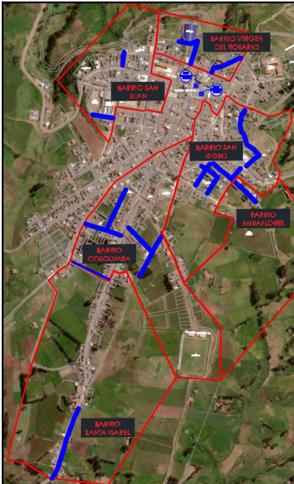
Figura N°7: Ubicación Ámbito de Influencia de los 6 barrios en el Distrito de Julcan