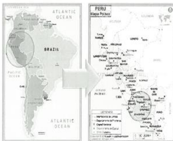
FIGURA N° 01 - MAPA DE UBICACIÓN MACRO

Provincia : Huamanga Distrito : San Jose de Ticllas Región : Ayacucho