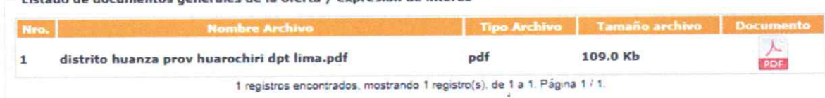
Listado de documentos generales de la oferta / expresión de interés

(2) EL POSTOR, CONSTRUCTORA TORRES RODRIGUEZ S.A.C.- se identifica que en el sistema electrónico de contrataciones con el estado SEACE, en el apartado de "Listado de documentos generales de la oferta / expresión de interés", adjunta únicamente la constancia de participación, la cual consta de un solo folio con un peso de 109.0 kb tal como se aprecia en la siguiente imagen: