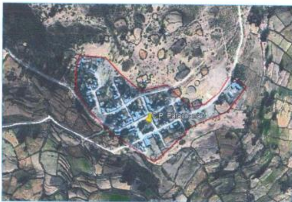
Ubicación del C.P. Patachana

SUB GERENCIA DE INFRAESTRUCTURA Y DESARROLLO URBANO