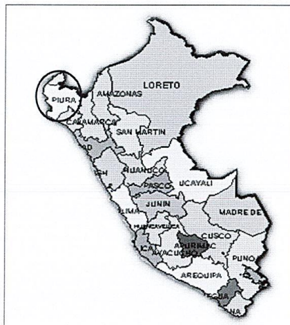
IMAGEN 02 LOCALIZACIÓN GRÁFICA DE LA PROVINCIA DE MORROPON – DISTRITO DE CHULUCANAS